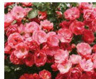
ガーデン内のバラ