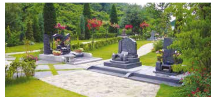
ガーデン内の風景

各地の樹木葬の中には、ある一定期間(20年や33回忌など)でお骨を移動されたり他の方のお骨と一緒に合葬されたりする樹木葬のシステムもあるようですが「倉敷バラの樹木葬 Jewel 」は一度お納めしたお骨は永久にそのままでお祀りします。